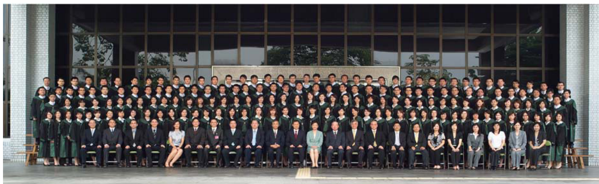
法務部司法官訓練所司法官第50期開訓合照 98.9.14