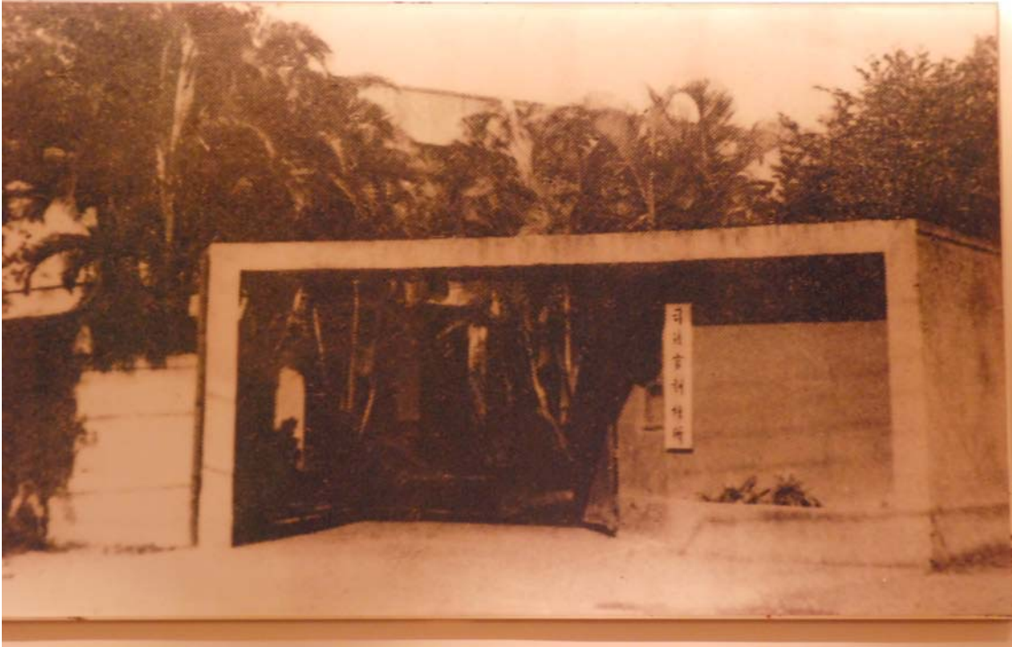
(司法官訓練所舊址-台北市重慶南路一段 128 號)