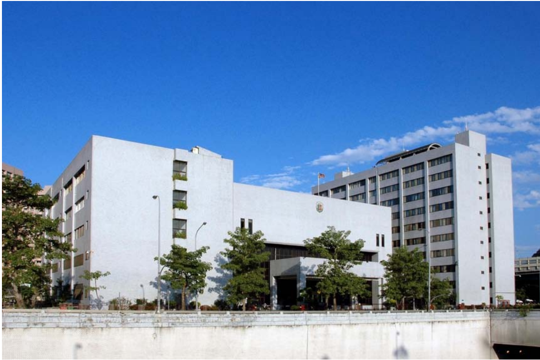
（司法官訓練所大樓外觀）