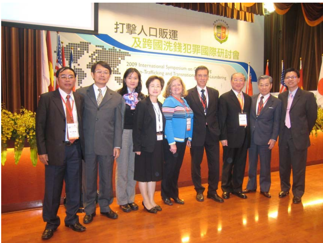
(98年12月打擊人口販運及跨國洗錢犯罪國際研討會，邀請瑞士法官等與會。)